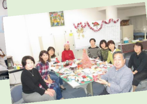
間違えても気にせず話せる場にするのも 学びのポイント。一番気にしているのは 実は自分だから...