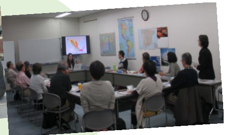
ゲストスピーカー交流 偶然にも2ヶ国の スペイン文化が学べた日