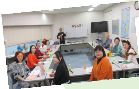
みんなハロウィン仕様で 英会話を楽しんだ日